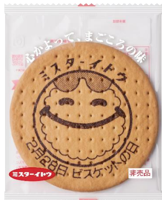
でかビスケット(でかビス)